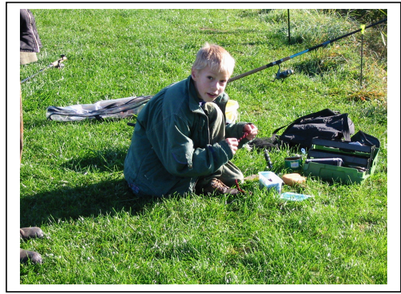
2002 am Tausendsee