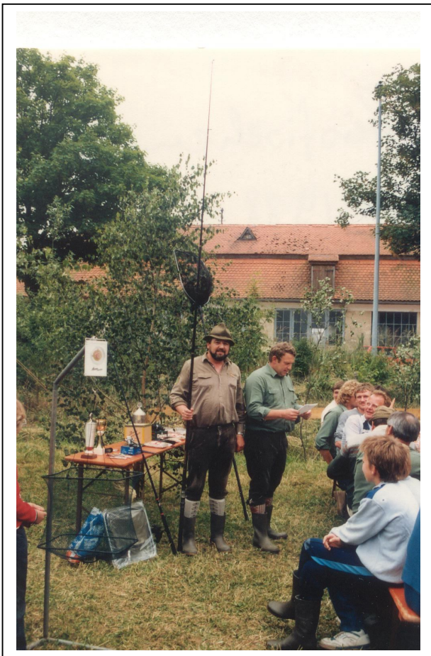
1988 Freundschaftsfischen Leutershausen