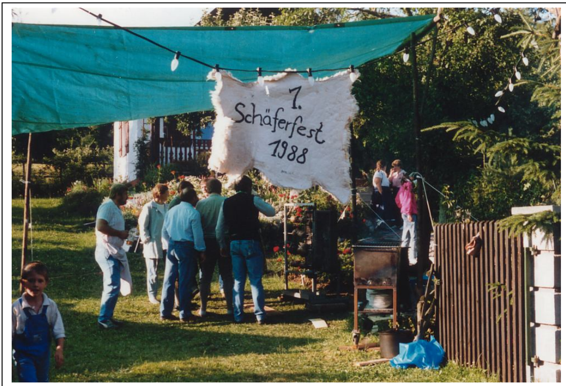
Arno Herbert spendete ein Schaf und daraus wurde das Schäferfest