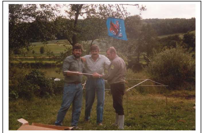
1988 Kallmünz an der Naab